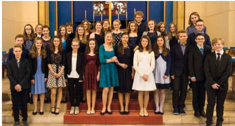
Getaufte und Konfirmierte vom 17. April 2016